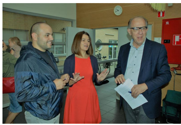
Concert "Mozart in Sint-Paulus", fundraising concert, 1 oktober 2017.