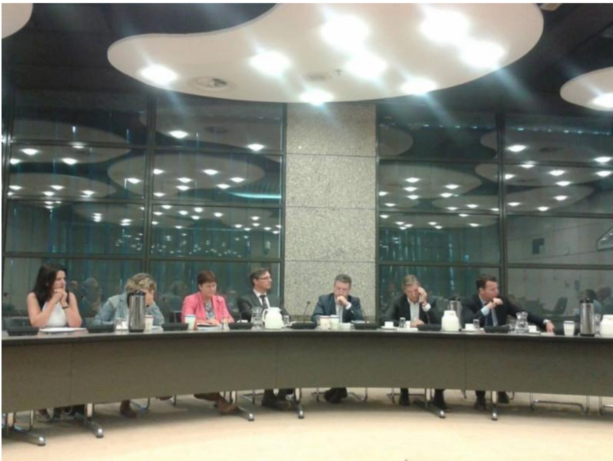
Samen in dialoog over vrouwen, emancipatie en islam (10/10/2013)