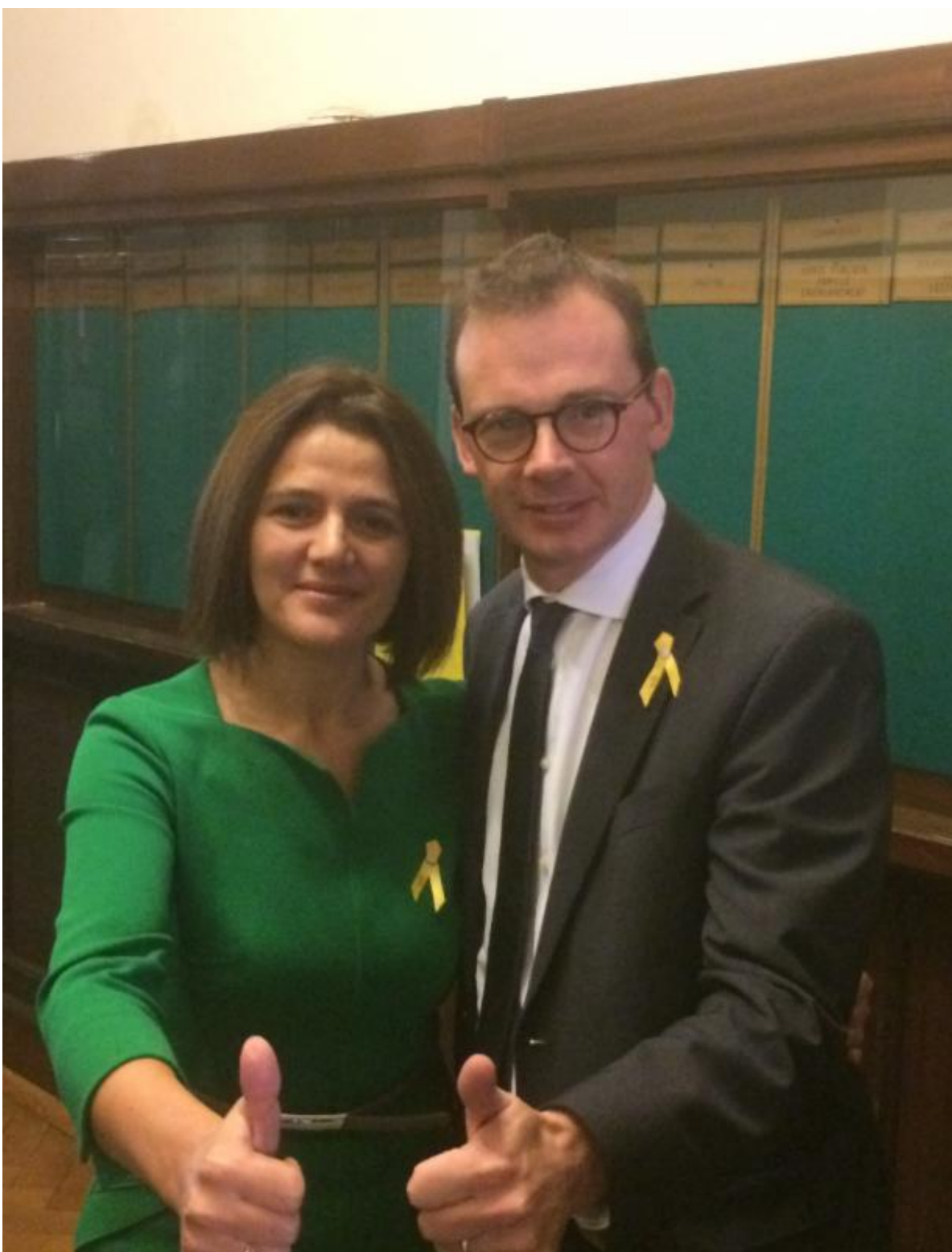
Geïnteresseerde jongeren met rake vragen van het Atheneum van Brasschaat op bezoek in de Kamer, 26 oktober 2016