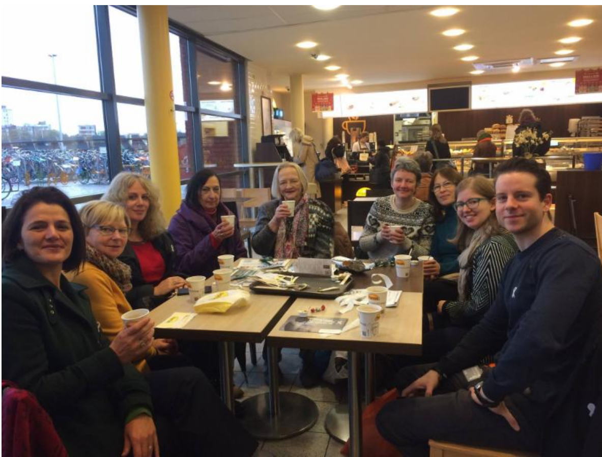
Kris Peeters komt ons team in Antwerpen versterken als lijsttrekker. Samen gaan we voor een verhaal dat mensen verbindt.