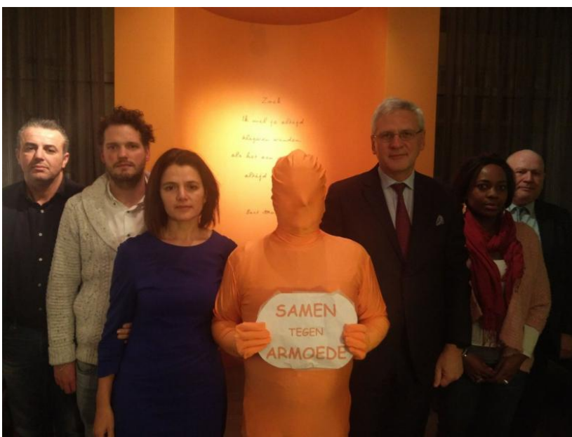
Nieuwjaarsreceptie CD&V Sint-Katelijne Waver