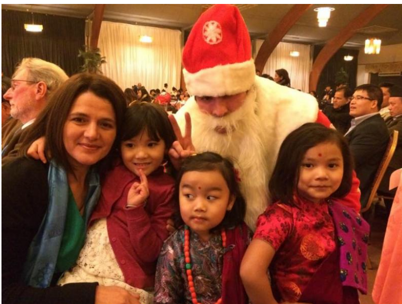
Al Ikram organiseerde een kerstdiner voor minderbedeelden in de Roma