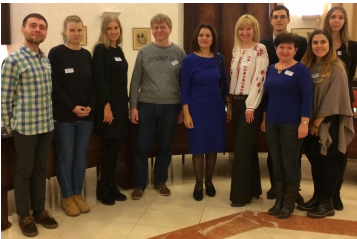
Agentschap Integratie en Inburgering op bezoek, 14 december 2016