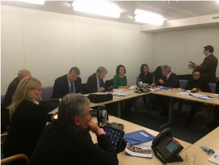
Als gastspreker op de nieuwjaarsreceptie van CD&V Herentals