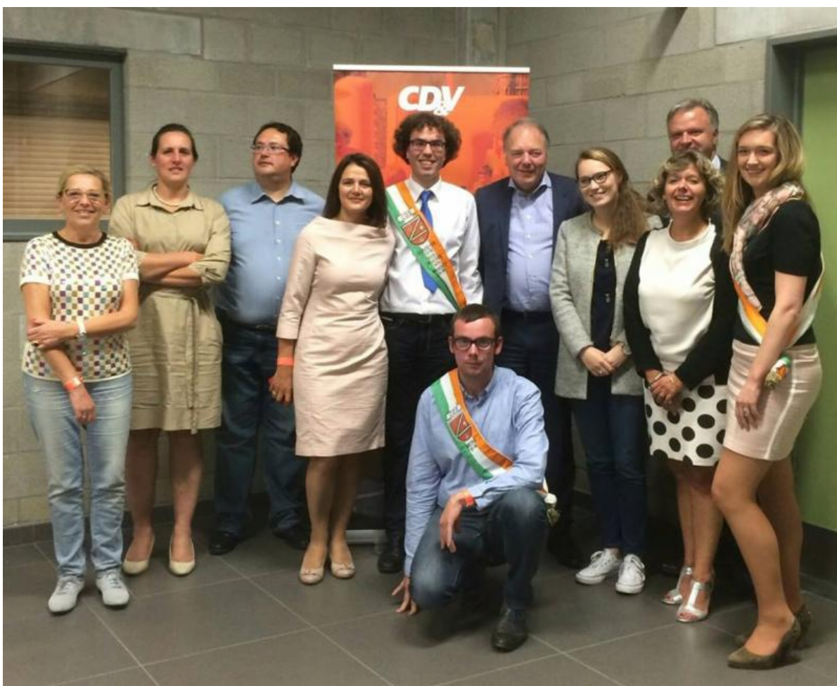
De uitreiking van 't Sociaal Reuzeke 2015, zaterdag 26 september