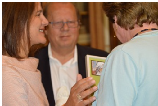
Toelichting over de tax shift en de vluchtelingencrisis bij de CD&V Senioren van Essen, vrijdag 2 oktober