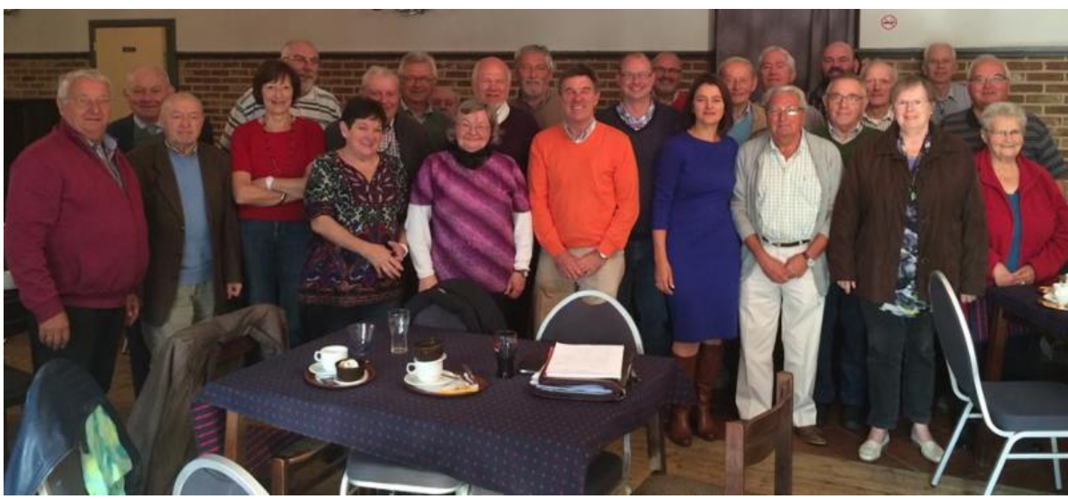
Een bezoek gebracht aan de brunch van Vrouw en Maatschappij Rumst, zaterdag 11 oktober