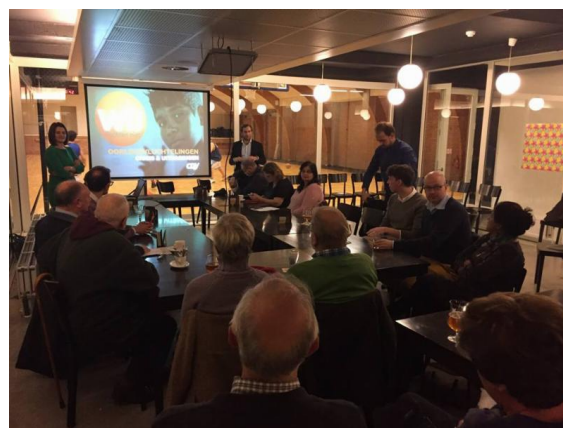
Werkbezoek aan het opvangcentrum in Arendonk, 30 oktober