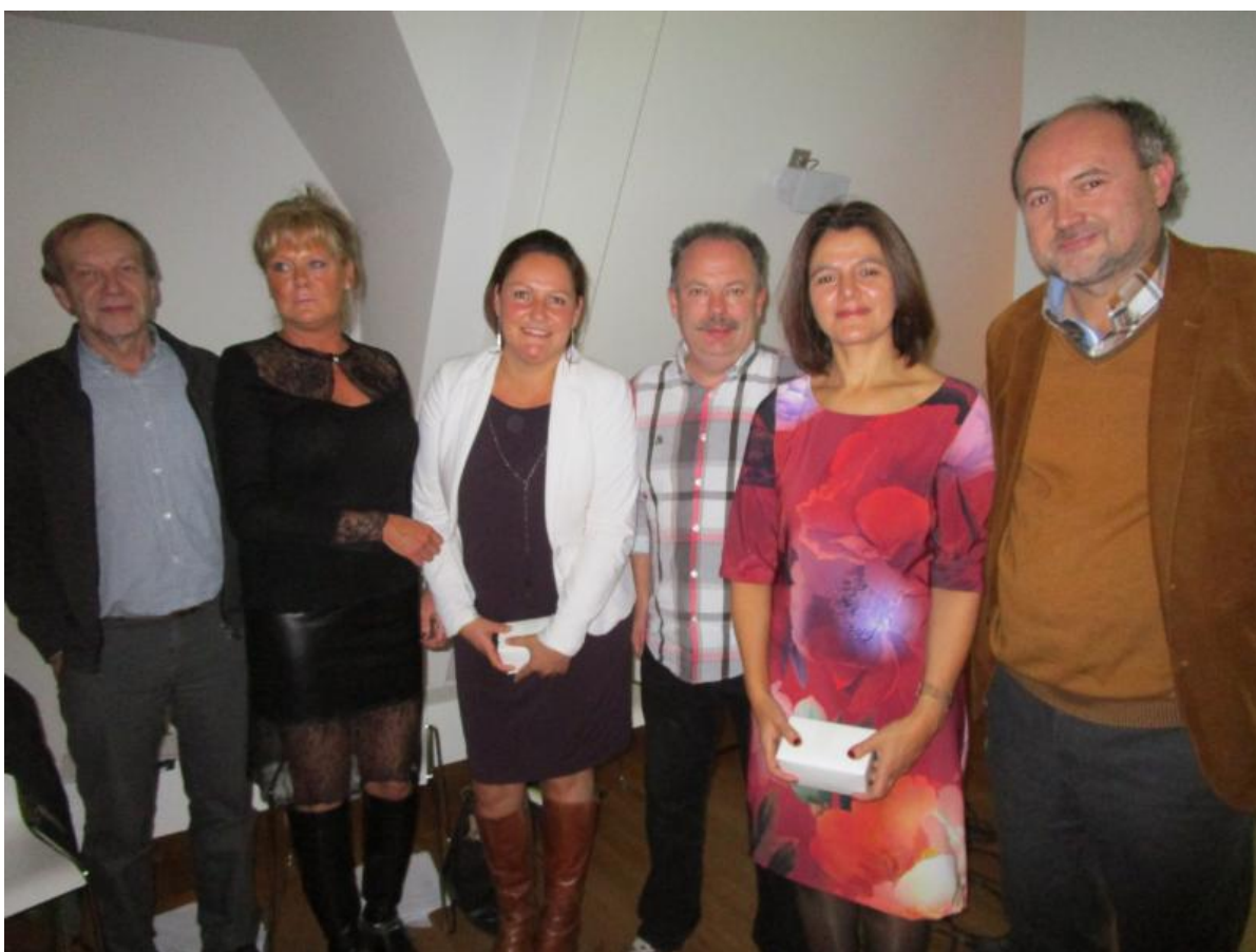
Donderdag 29 oktober, CD&V Antwerpen en Borgerhout