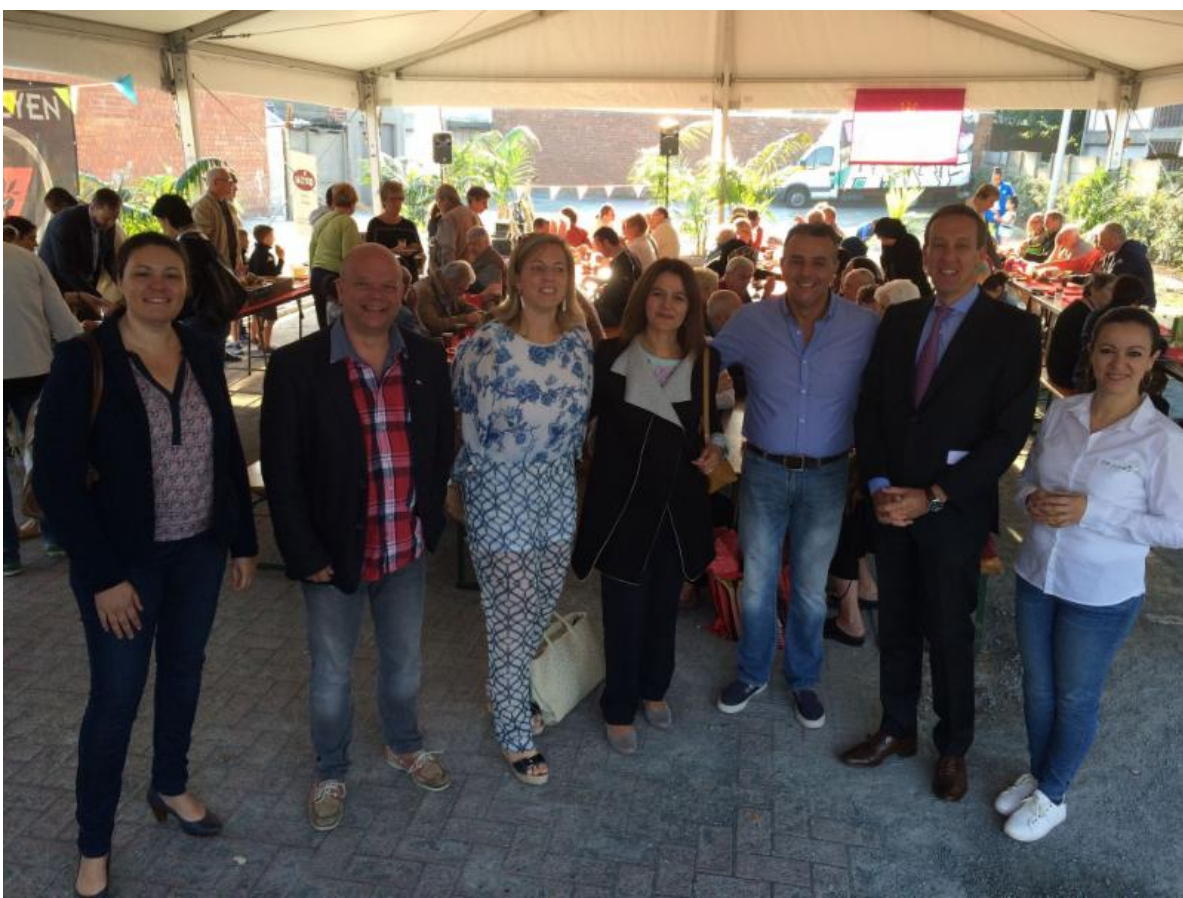
Gastrij Antwerpen 2 op woensdag 28 september was weer zeer geslaagd. Proficiat aan de organisatoren!