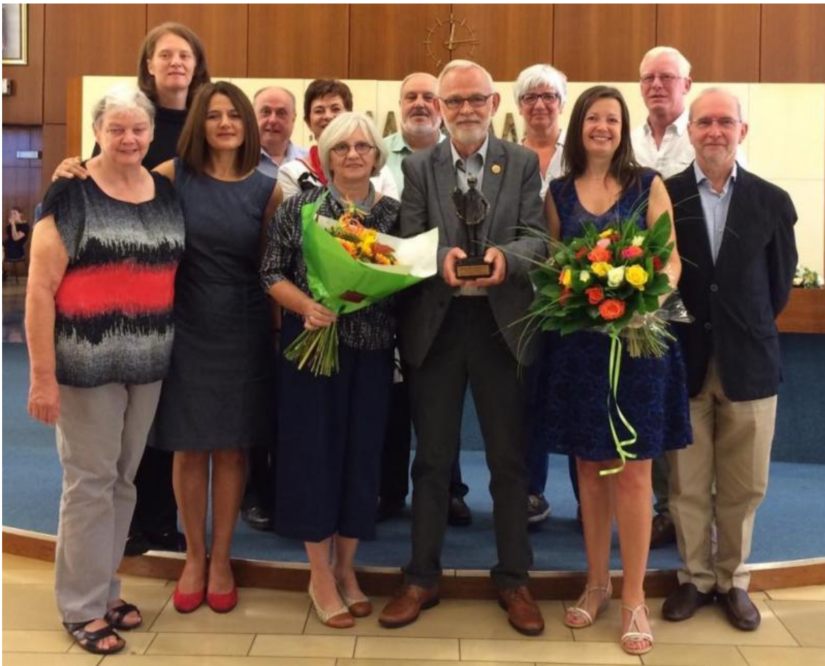
Een zonnige UNIZO - Dag van de Klant in winkelcentrum Deurne-Zuid op zaterdag 24 september