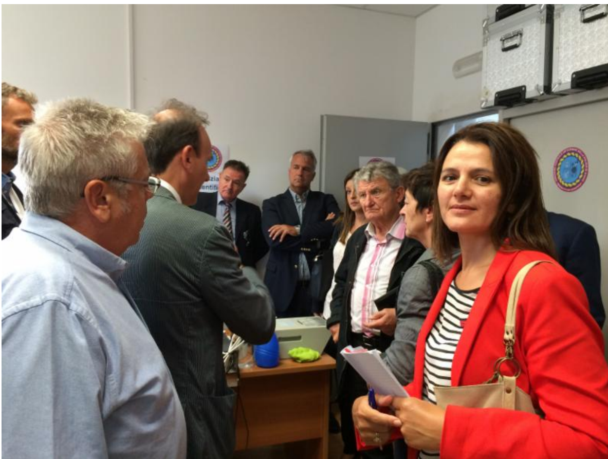
Toffe en zonnig teambuilding op de fractiedagen begin september.