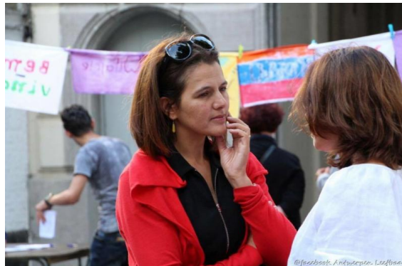
Op 17 september trok de 304de Reuzekesstoet weer door Borgerhout. De vele omstaanders