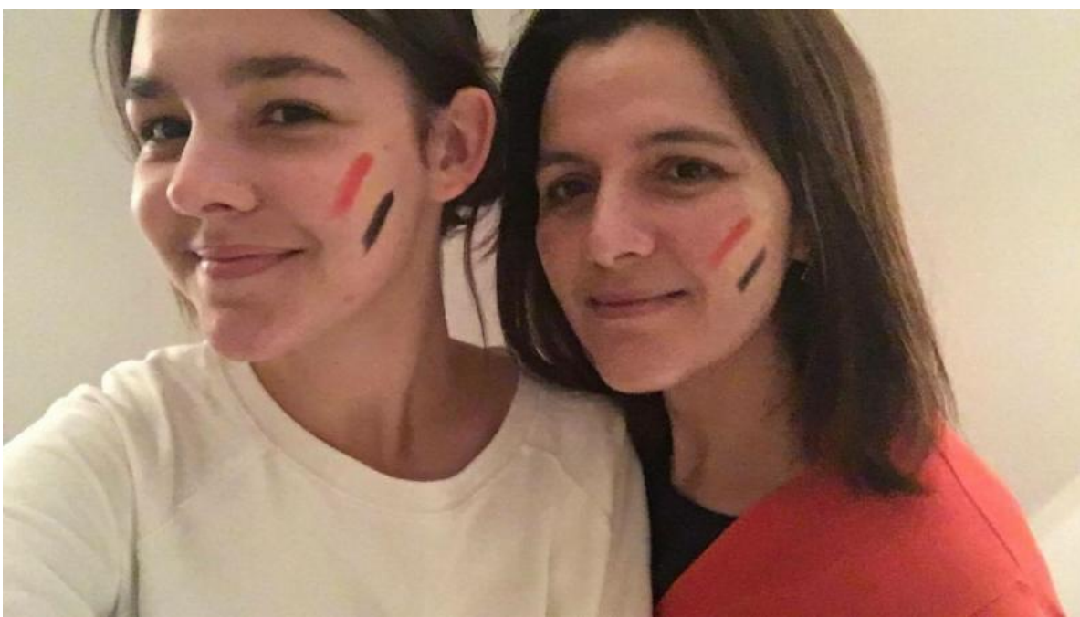
Startmoment Vrouw en Maatschappij provincie Antwerpen, 12 juni