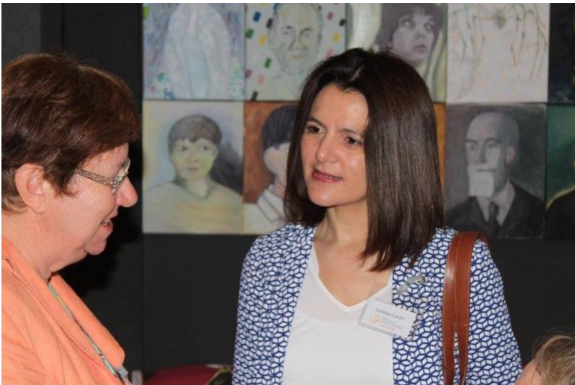
Tussen 6 juni en 6 juli was het de Ramadan voor de moslimgemeenschap. Ik was aanwezig op enkele zeer geslaagde iftars, de vastenverbreking, in Hoboken, Berchem en Brussel.