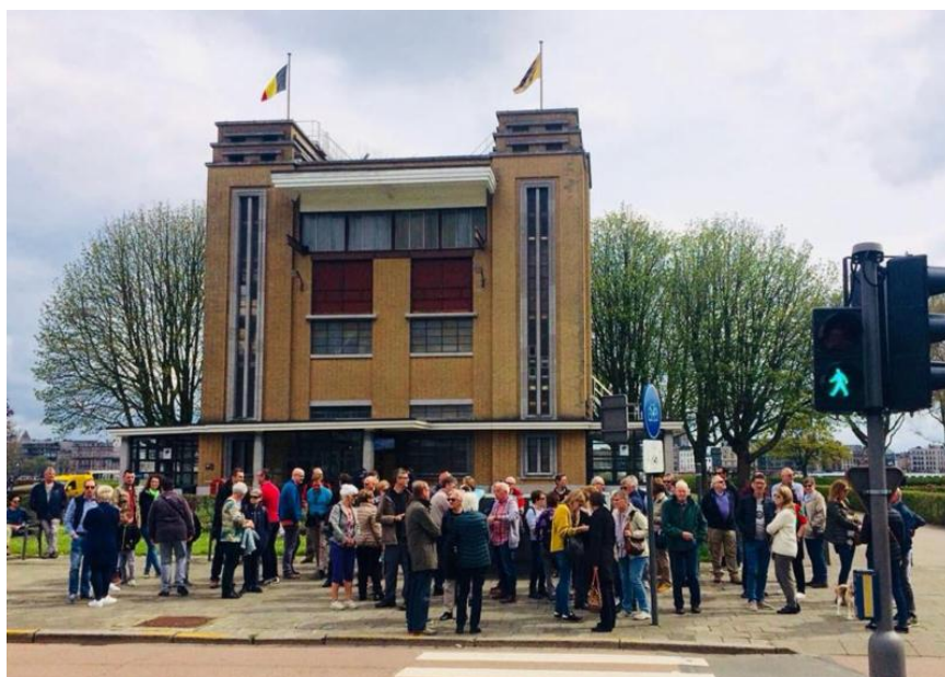
Aanwezig bij de start van het vaarseizoen van de Antwerpse zeescouts.