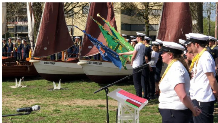
Boeiende getuigenissen en interessante ontmoetingen op ons Stadsatelier Samenleven