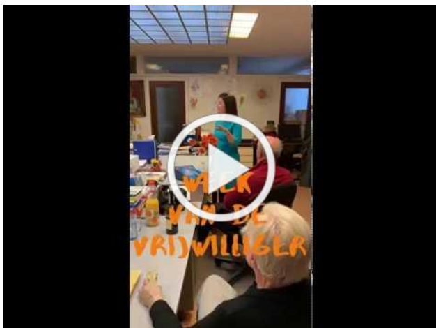
Week van de vrijwilliger

Meer dan 1 miljoen Belgen zetten zich op een of andere manier vrijwillig in: leiders van een jeugdbeweging, huiswerkbegeleiders, leden van een buurtcomité, vrijwilligere medewerkers van een welzijnsorganisatie, ... Zij zijn vaak meer dan helpende handen: ze zijn de dragende kracht van vele organisaties. Dat is onbetaalbaar en onvervangbaar, want het engagement dat je als vrijwilliger opneemt, dat neem je op met heel je hart.