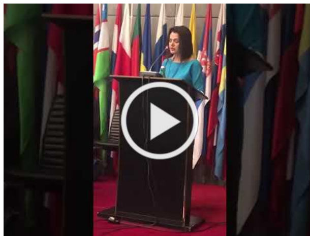
Wintermeeting OVSE in Wenen

Vorige week was ik enkele dagen in Wenen voor de winterzitting van de Organisatie van Veiligheid en Samenwerking in Europa (OVSE). Ik bracht aan ruim 500 parlementsleden uit 57 landen verslag over "migratie en intergratie in de Europese regio". Ik benadrukte dat we er belang bij hebben om eenzelfde opstelling te hebben inzake migratie. Uit het debat met de collega-parlementairen stak ik ook weer wat op om tot een echt humaan vluchtelingenbeleid te komen.