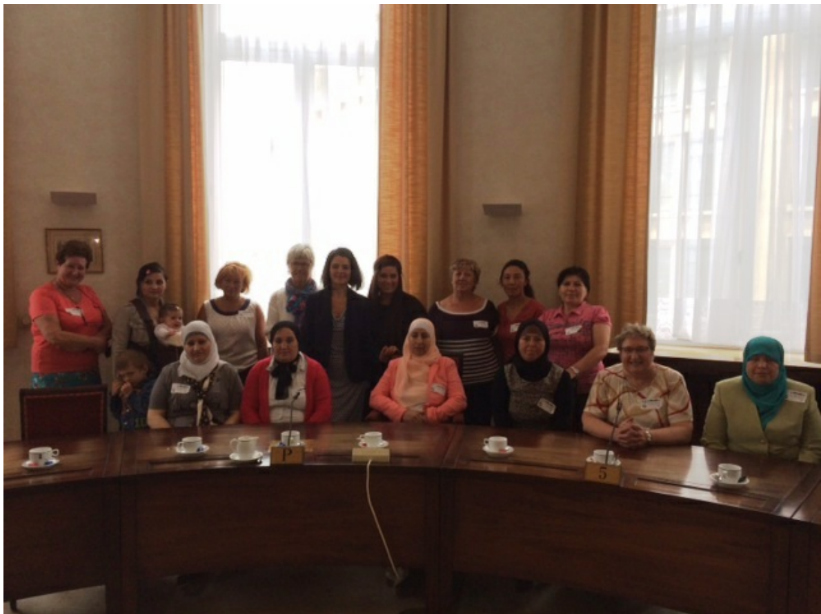
Bezoek KWB Noord-Antwerpen (26 juni 2014)