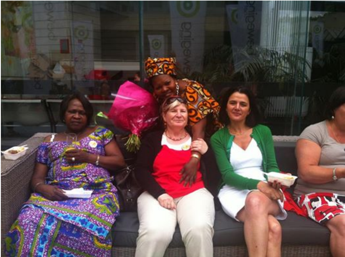
Etentje bij de plakploeg van Loenhout (21 juni 2014)