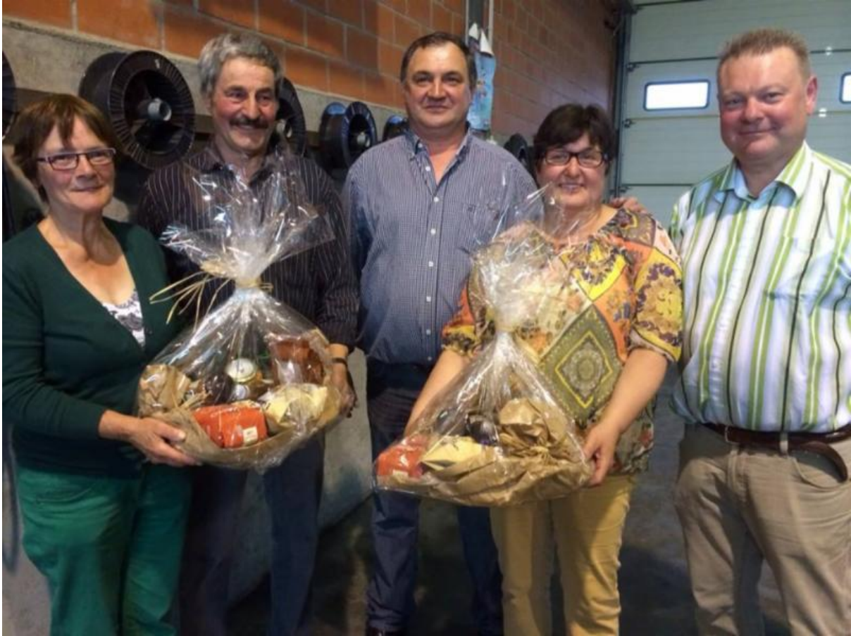
Commissie mensenrechten op de vergadering van de OVSE ( Organisatie voor Veiligheid en Samenwerking in Europa ) in Baku (30 juni 2014)