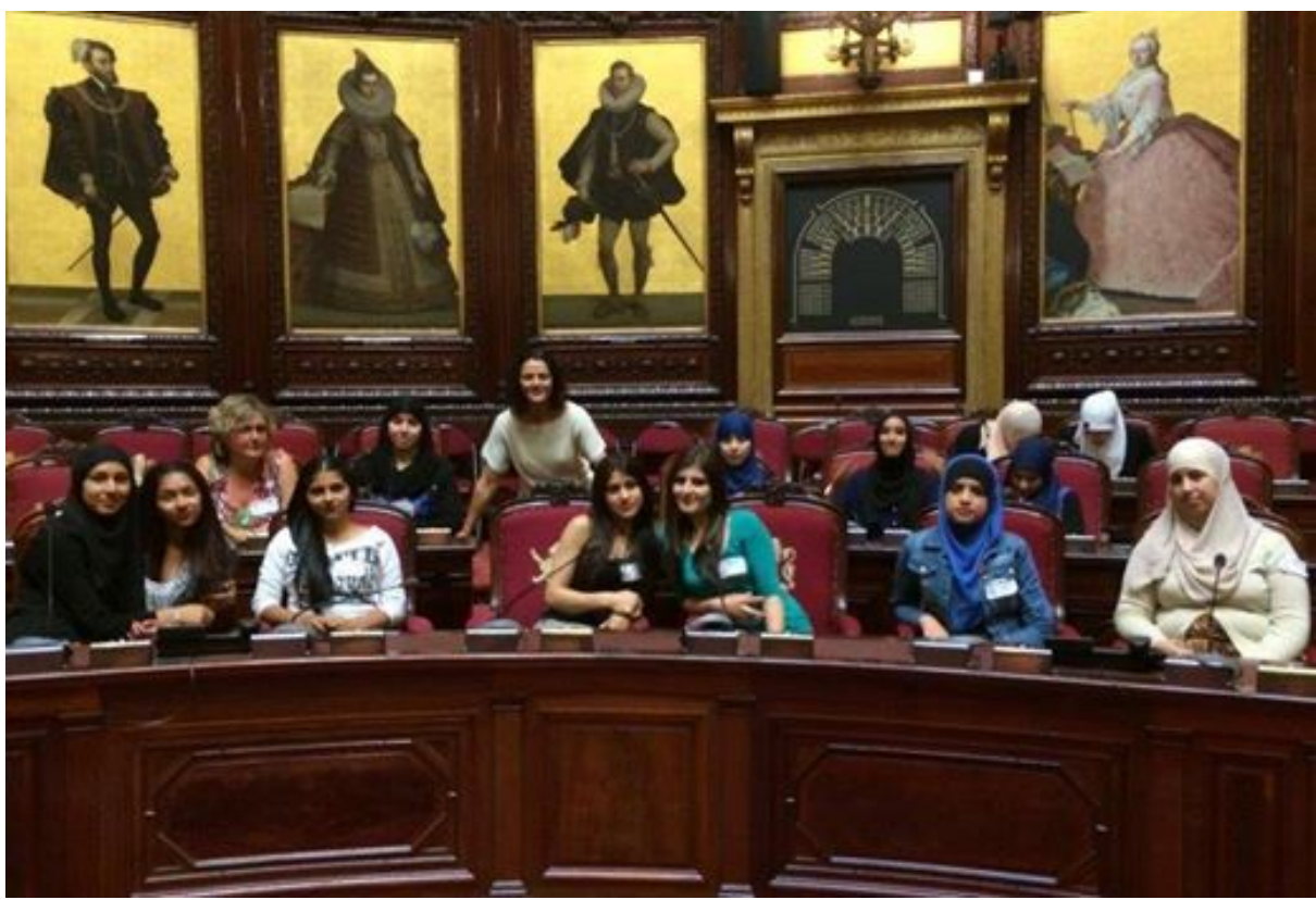
Met de Nederlandse taalklas uit Duffel op bezoek in het parlement (17 juni 2014)